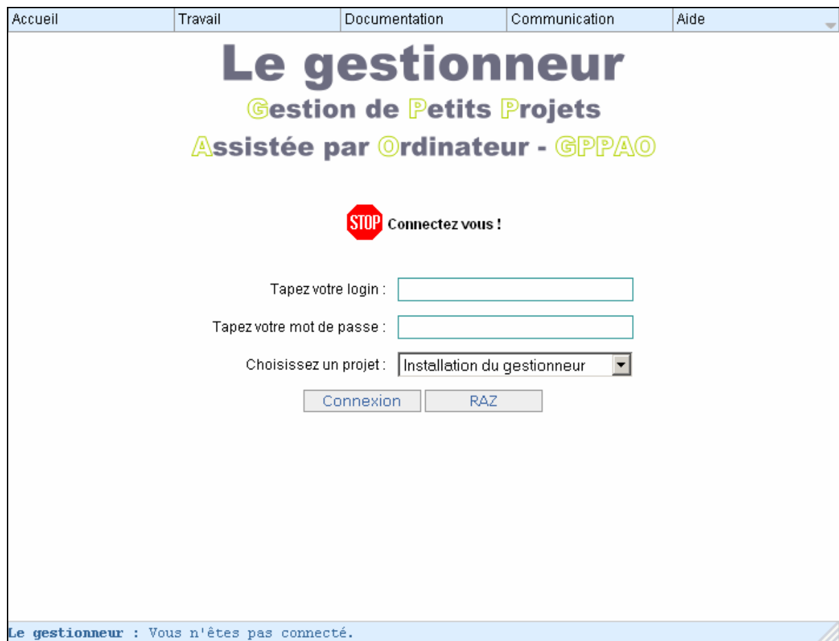
Figure 4 : Page de connexion au gestionneur

Le projet « Installation du gestionneur » est créé ainsi qu'un utilisateur avec l'identifiant suivant :