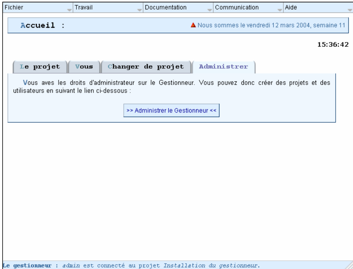
Figure 5 : Première page d'accueil

Une fois connecté sur le gestionneur avec l'utilisateur admin, vous pouvez paramétrer votre gestionneur. Pour cela, sur la page d'accueil, dans l'onglet « Administrer », cliquez sur « Administrer le gestionneur ».